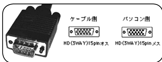
会場で用意する VGA ケーブル (見本)