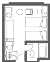
ウエストツインルーム